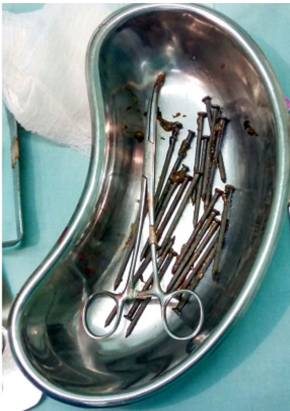
Figura 5: Pregos removidos.

Realizou-se então a terceira laparotomia exploradora e foram retirados 10 pregos em região gástrica e 10 em porção medial jejuno (figura 5). No quinto dia de pós-operatório, o paciente evadiu do hospital.