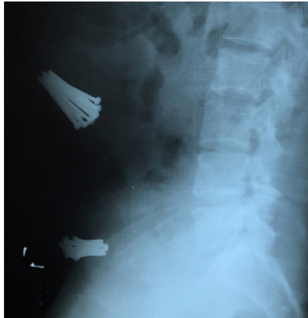
Figura 4: Radiografia de perfil com presença de corpos estranhos.