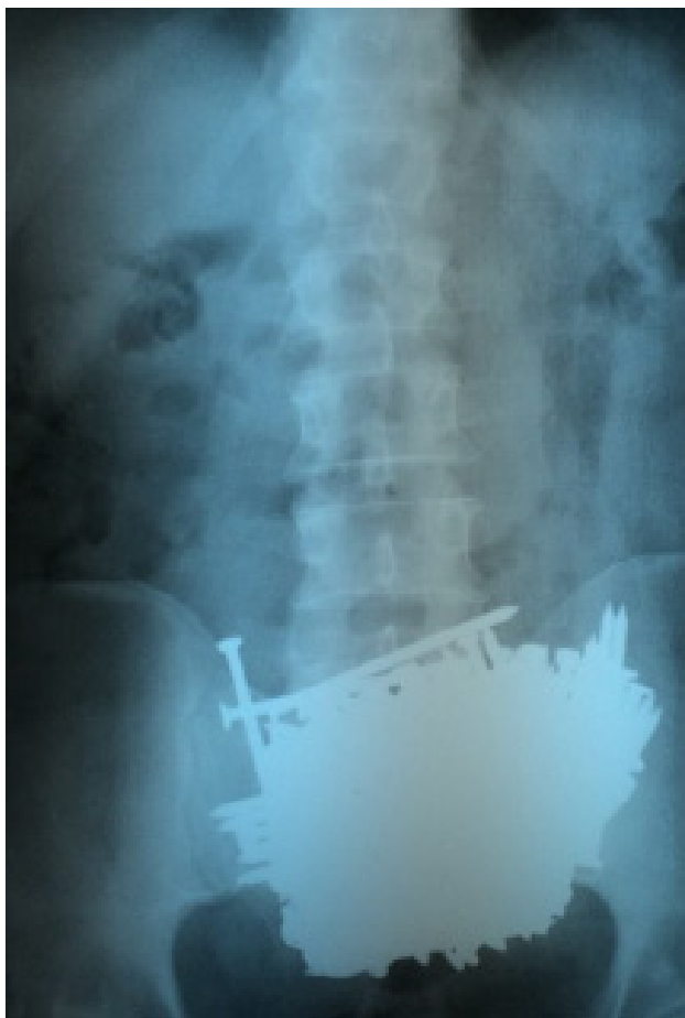
Figura 2: Radiografia de abdome evidenciando bezoar em região pélvica.

Após 5 meses da primeira cirurgia, o paciente retornou ao HUSF com relato de nova ingestão de pregos e sintomatologia dolorosa abdominal, sendo então submetido a nova laparotomia exploradora, com retirada de 41 pregos em corpo gástrico, com tamanho variando de 5 a 15 centímetros. Dois meses após esta segunda cirurgia, o paciente foi internado, relatando recidiva de ingestão de pregos (aproximadamente 20 unidades), sem queixas álgicas. Foram realizadas radiografias pósterio-anterior (PA) e perfil de abdome, por meio das quais se constatou a presença dos corpos estranhos em locais distintos, região gástrica e de jejuno (figuras 3 e 4).