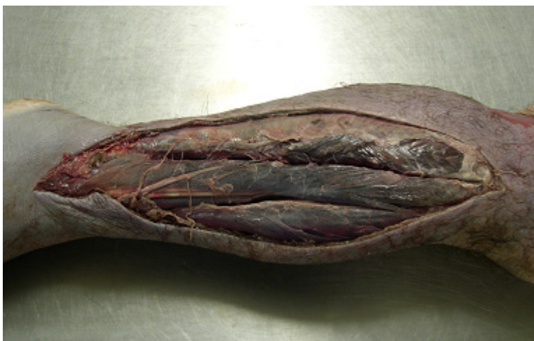
Figura 1: Face lateral da perna esquerda amputada com evidência de necrose extensa (fascíte necrotizante).

A UE do HCFMRP-USP é o hospital de referência ao atendimento das vítimas de acidentes ofídicos da Divisão Regional de Saúde do Estado de São Paulo XIII (DRS-XIII). O Centro de Controle de Intoxicações (CCI) deste hospital, informa que, no período de janeiro de 1995 a dezembro de 2007 foram hospitalizados