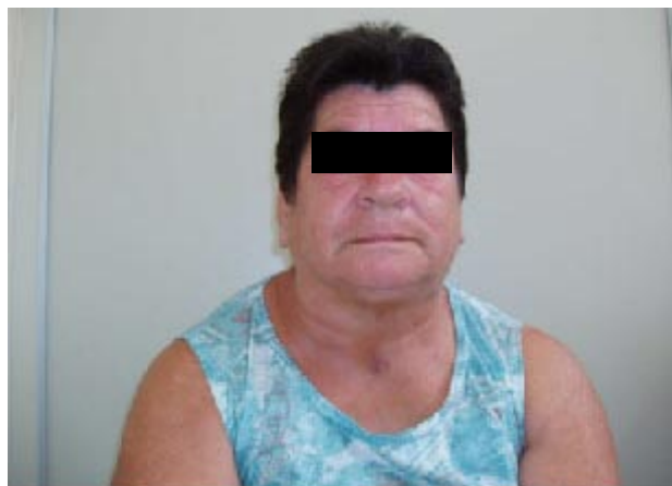
A) Paciente na posição inicial

O bócio multinodular pode causar obstrução da traquéia e quando retroesternal também a obstrução da veia cava superior. O sinal de Pemberton (Figura 5) aparece quando se eleva o braço do paciente acima da cabeça. Esta manobra faz com que o paciente fique dispneico, com distensão das veias do pescoço, pletora facial ou com estridor 7 .